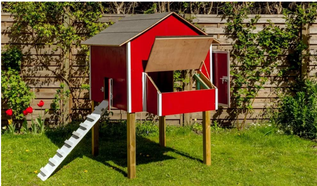
Visualisatie van het kippenhok: